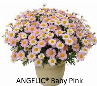
ANGELIC® Baby Pink