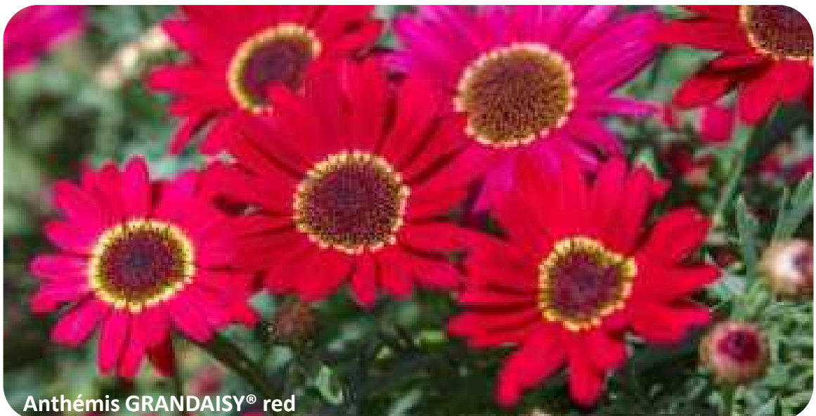
Anthémis GRANDAISY® red