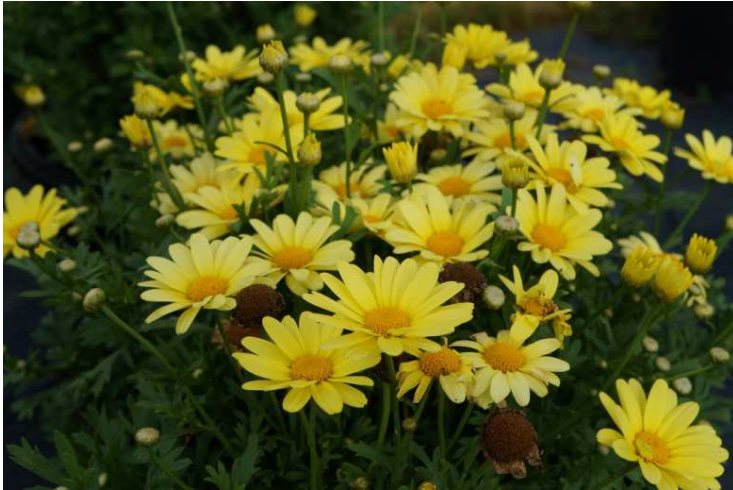
Anthémis BEAUTY YELLOW®