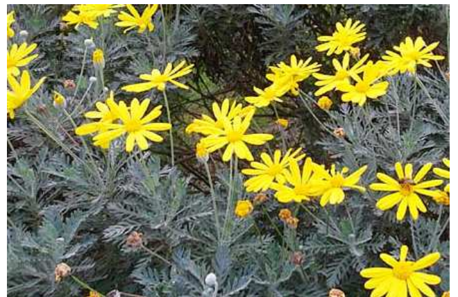
Anthémis / Euryops SOLEIL ORANGE